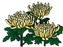
昨年の出展作品の様子